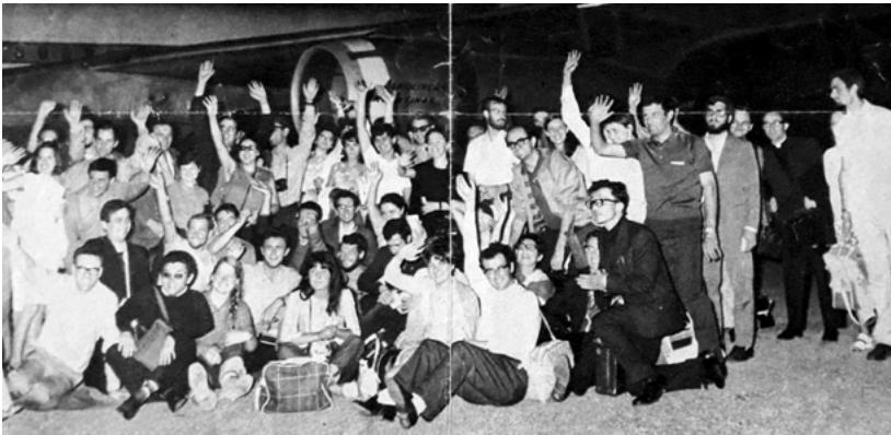
Famiglia Cristiana, agosto 1969. I giovani dell'Operazione Mato Grosso per Brasile e Bolivia

Chiede all'Arcivescovo di Vercelli di restare ancora laggiù; Monsi-