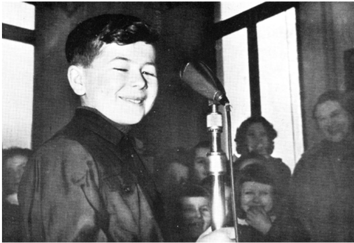
1955: un giorno d'inverno, nel programma RAI "La radio per le scuole"

Egli amava le cose precise e non era certamente il tipo da lasciarsi prendere dalla fantasia. Tutti i suoi quaderni sono puliti ed ordinatissimi scritti in bella calligrafia, caratteristiche che non perderà mai, anche quando scriverà dalla Bolivia nelle tarde ore notturne.